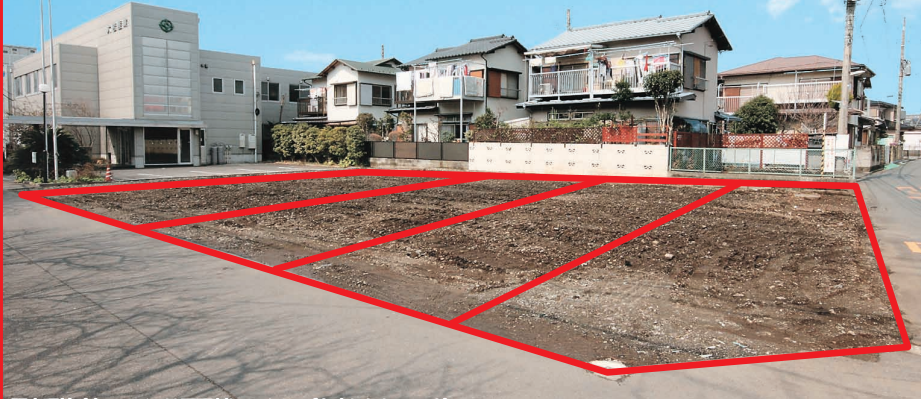
販売現地(赤のラインは区画割りのイメージを表したものです)